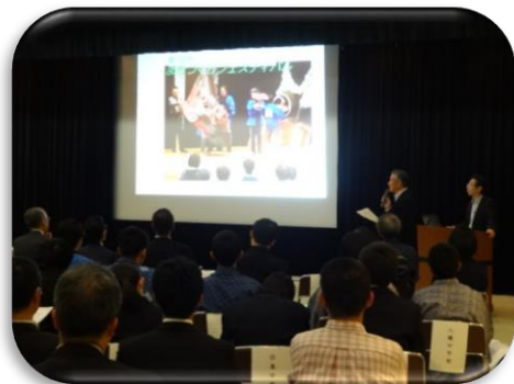
地域団体発表：小那比夢ビジョン実行委員会

今年で7回目を迎える「郡上まちづくりフェスティバル」が昨年十一月二十八日に開催されました。 市民協働によるまちづくりの取り組みを進めようと、毎年開催されています。 今年も、地域・市民活動団体の報告として、小那比夢ビジョン実行委員会とNPOコミシス郡上の2団体より活動経過報告がありました。 第4回からは協働センターが運営主体となり、市民提案型・参加型のイベント、「まちづくりプロジェクト」を実施してきました。 前回から、郡上の未来をテーマに「GOOD郡上プロジェクト」として中学生の子ども達からの課題解決型の提案を募集し、今年も市内5校から82件の提案があり、226名の生徒が参加してくれました。 その中から今回は7件の優秀提案を選考し、当日子ども達自身から提案のプレゼンテーションを受けました。 提案内容は、2Pと3Pに掲載いたします。