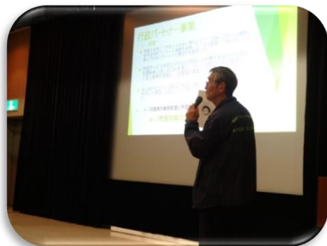
市民団体発表：コミシス郡上