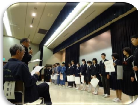
選考された7提案の表彰